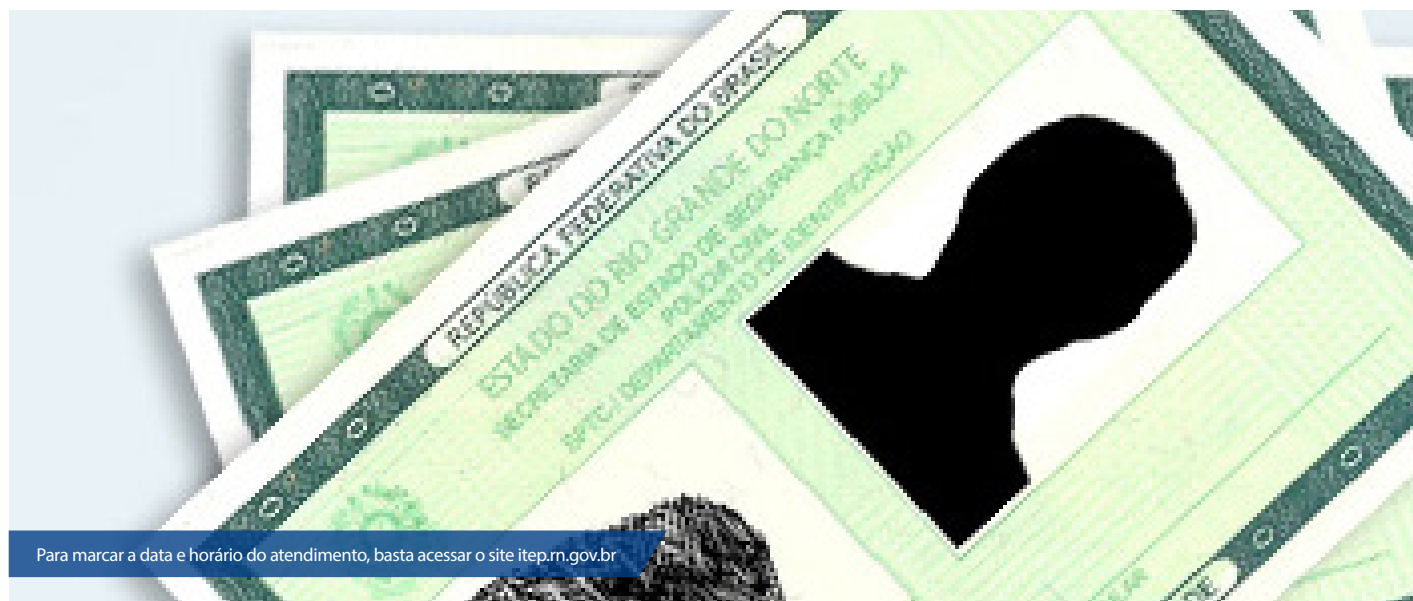
Para marcar a data e horário do atendimento, basta acessar o site itep.rn.gov.br