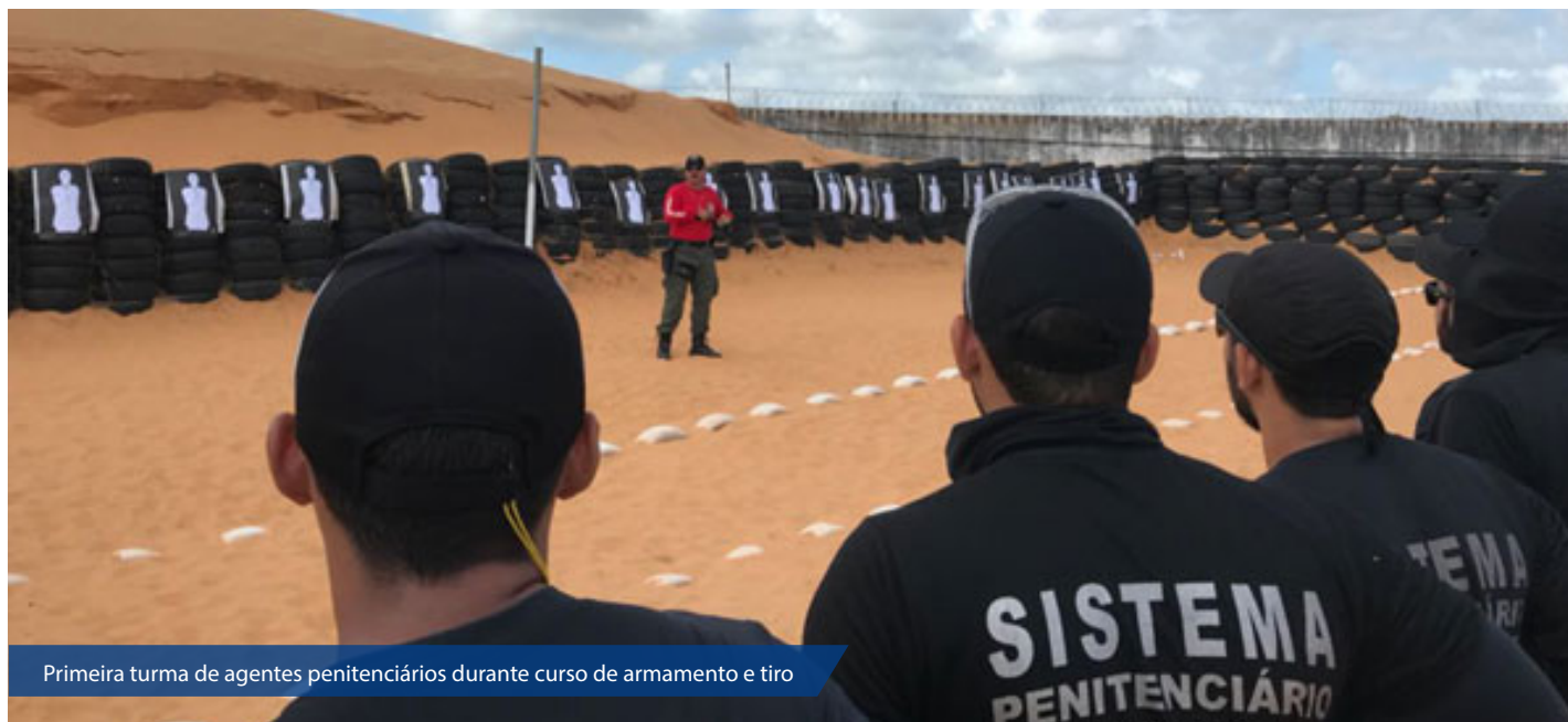
Primeira turma de agentes penitenciários durante curso de armamento e tiro

Após a capacitação, que complementa o treinamento recebido durante o curso específico de formação, com conteúdos adequados à Matriz Curricular Nacional, do