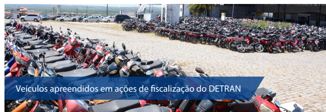
Veículos apreendidos em ações de fiscalização do DETRAN

O candidato que for responsável pelo arremate de qualquer bem deve assinar um comprovante de arrematação contendo número, valor e descrição do lote, como também efetuar o pa-